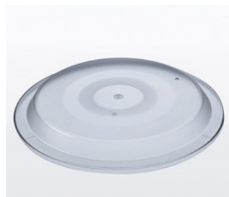
30277 Bordendeksel zonder greep, transparant t.b.v. diepvriesmaaltijd, hittebestendig tot 140°C, 260x40mm (ø x H)