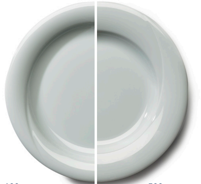
400 gramsgerech maaltijdbord

Het realiseren van ambiance in de zorg, wordt gecompleteerd met een bijpassende sauskom, soepmok, RVS cloche en een kunststof onderbord.