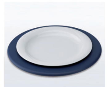
25003 Onderbord kunststof blauw Leverbaar in diverse kleuren, ø 320mm