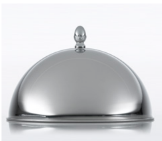
Cloche roomservice RVS 18/10 Inclusief stapelbescherming 24982 260x130mm (ø x H) 30286 240x130mm (ø x H)