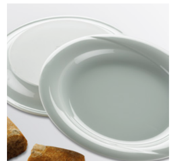
Systeembord 400 gramsgerech Met vlakke bodem, spiegel ø 190mm 827100 wit ø 255mm, VE 6 850863 wit ø 230mm, VE 6