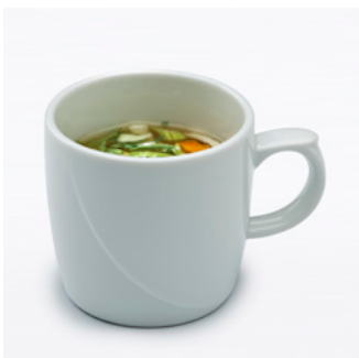
830183 Soepmok wit 300cc Met vlakke bodem, 85x82mm (ø x H), VE 6