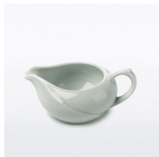
830531 Sauskom wit 90cc Past onder bordendeksel, 70x47mm (ø x H), VE 4