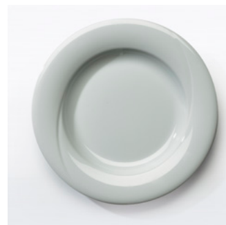
Systeembord 300 gramsgerech Met vlakke bodem, spiegel ø 165mm 853816 wit ø 255mm, VE 6